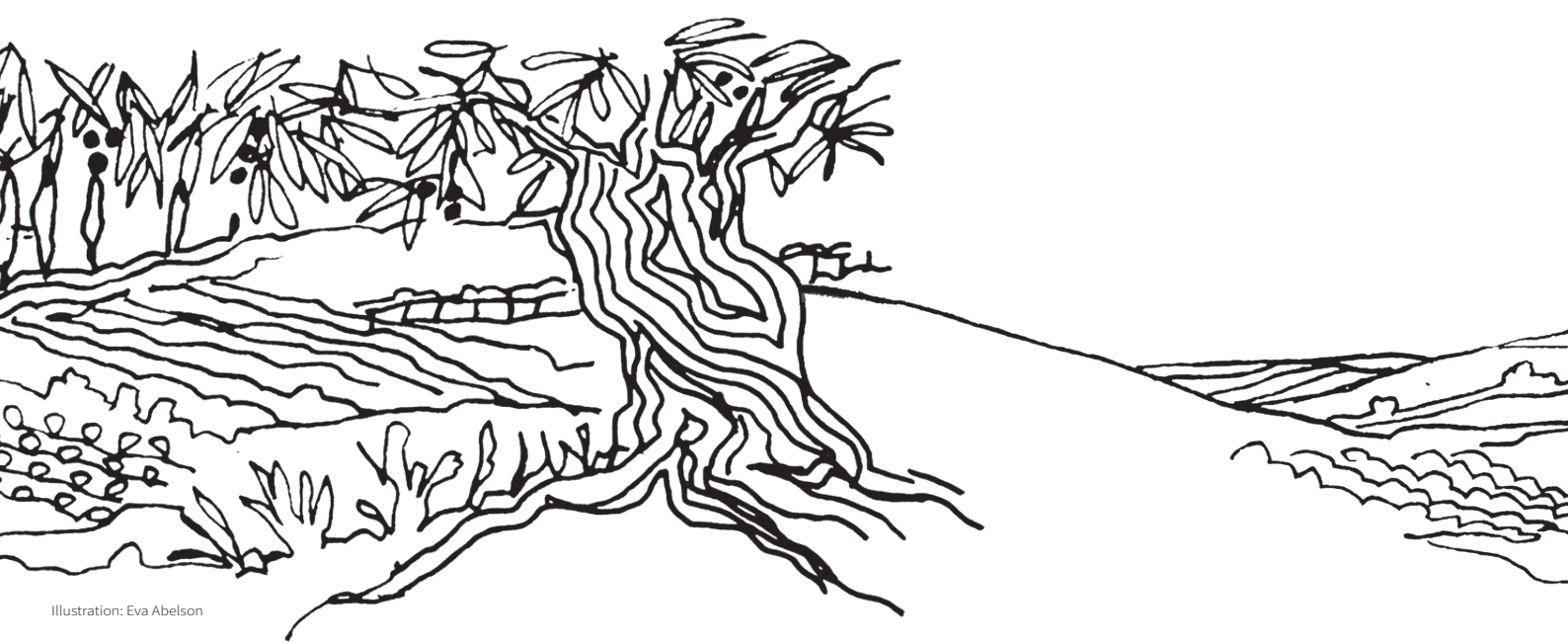
Illustration: Eva Abelson